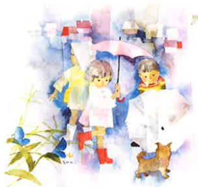
《小犬と雨の日の子どもたち》1967年