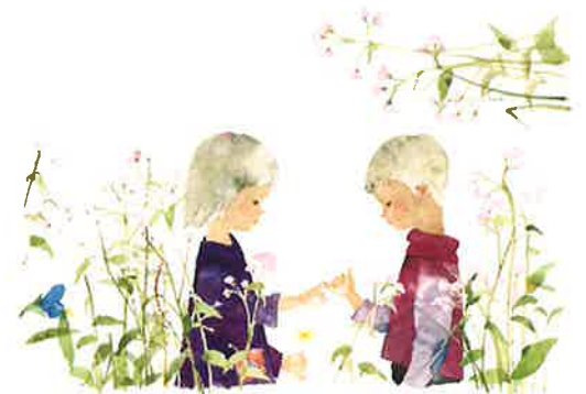
《ゆびきりをする子ども》1966年