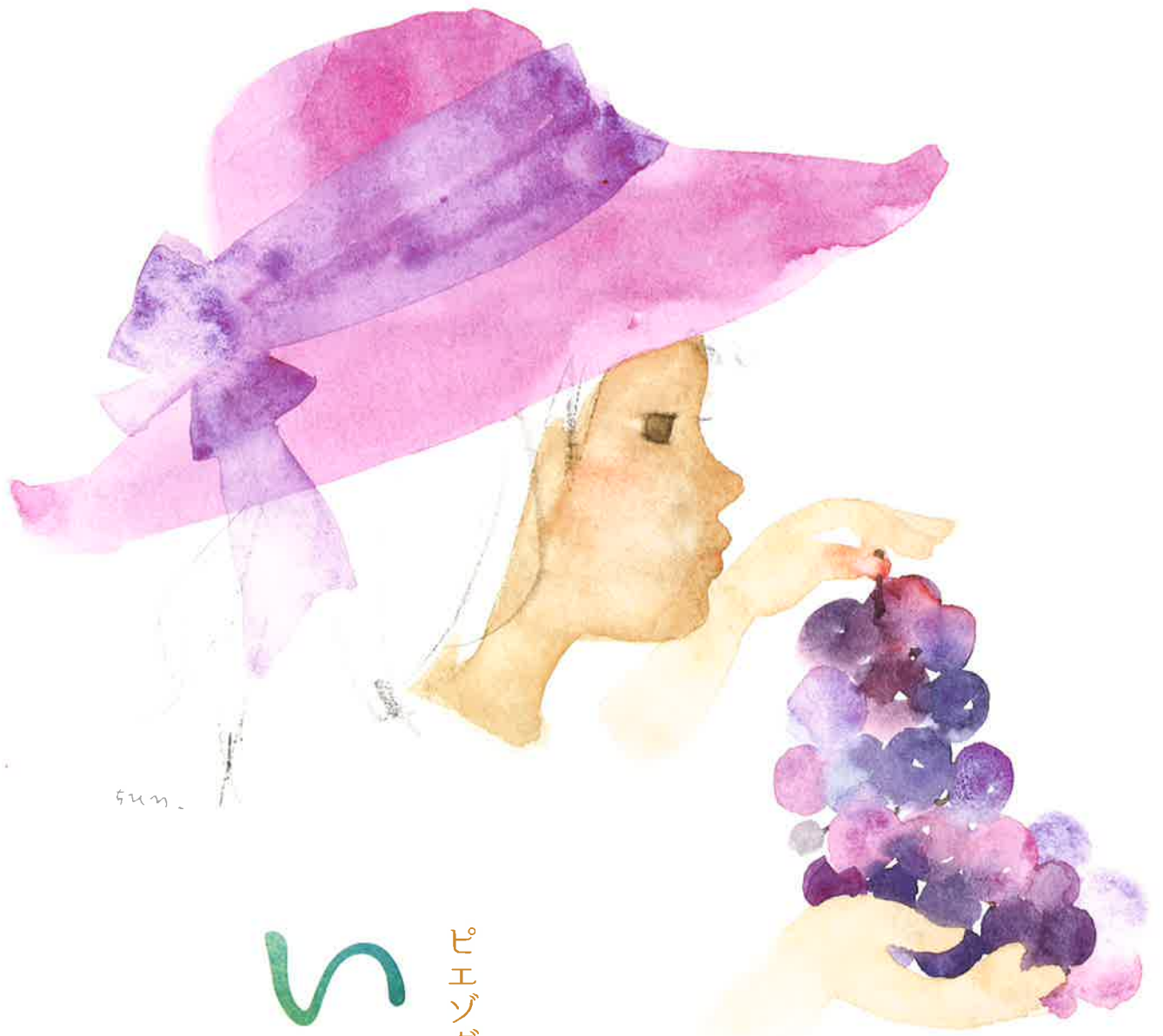
《ぶどうを持つ少女》1973年