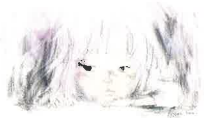
《戦火のなかの少女》1972年 『戦火のなかの子どもたち』