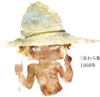
《麦わら帽子をかぶったおにた》 1969年 『おにたのぼうし』