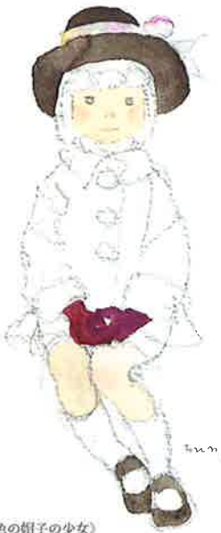
《こげ茶色の帽子の少女》 1970年代前半